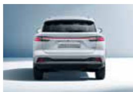
Πίσω μετατρόχο 1.584mm Πλάτος (χωρίς καθρέπτες) 1.890 mm