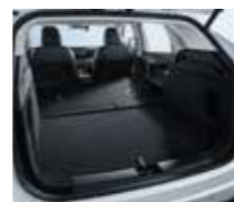
Χωρητικότητα μπαγκάζ (καθίσματα κάτω) 1.484 λίτρα