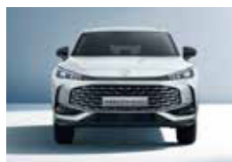
Εμπρός μετατρόχο 1.590mm Πλάτος (με καθρέπτες) 2.066mm