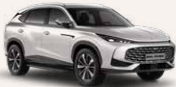
● Sterling Silver Μεταλλικό χρώμα