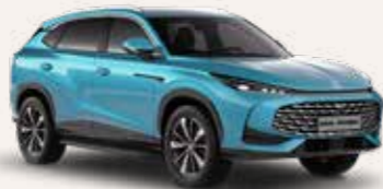
● Arctic Blue Μεταλλικό χρώμα