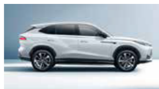
Μεταξόνιο 2.765 mm Μήκος 4.670mm