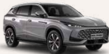
● Hampstead Grey Μεταλλικό χρώμα