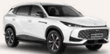
○ Pearl White Μεταλλικό χρώμα