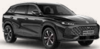
● Pebble Black Μεταλλικό χρώμα

Ορισμένα από τα εξαρτήματα που αναφέρονται και παρουσιάζονται σε αυτό το έγγραφο είναι στάνταρ μόνο σε ορισμένες εκδόσεις εξοπλισμού.