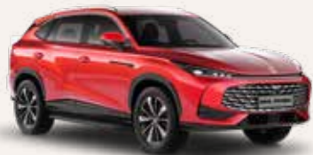
● Diamond Red Μεταλλικό χρώμα