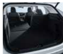
Χωρητικότητα μπαγκάζ (καθίσματα όρθια) 507 λίτρα