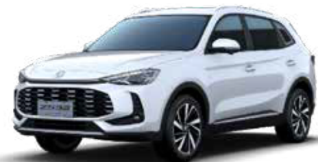
○ Dover White (στάνταρ)