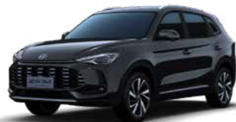
● Pebble Black (Μεταλλικό χρώμα)