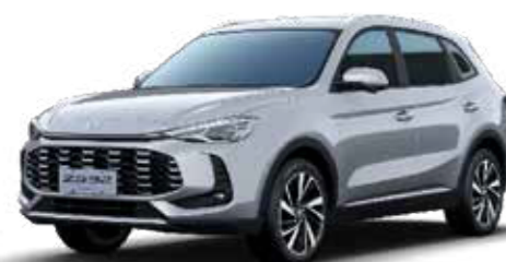
● Cosmic Silver (Μεταλλικό χρώμα)