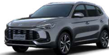
● Camden Grey (Μεταλλικό χρώμα)