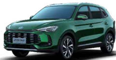
● Emerald Green (Μεταλλικό χρώμα)

Luxury - Μαύρα καθίσματα από δερματίνη/ύφασμα