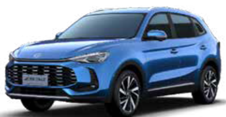
● Como Blue (Μεταλλικό χρώμα)