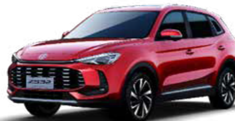
● Diamond Red (Μεταλλικό χρώμα)